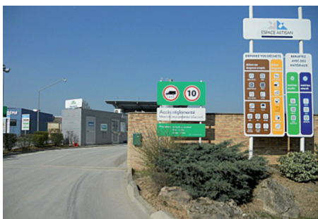
L'ESPACE ARTISAN respecte l'arrêté du 27 mars 2012 relatif aux installations de collecte de déchets.

En un seul voyage, il vous est possible de déposer tous types de déchets et de repartir avec des matériaux naturels ou recyclés de qualité, en vrac ou en big bag.